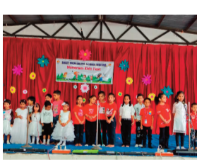
हरिभूमि न्यूज विदिशा