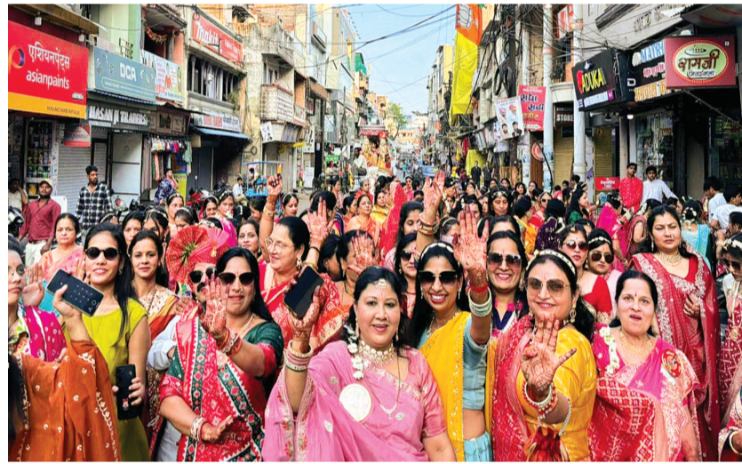
विदिशा। माहेश्वरी महिला मंडल ने गणगौर पर्व पर विशाल चल समारोह निकाला। बालबिहार से शुरू होकर यह नगर के प्रमुख मार्गों से होते हुए नंदवाना स्थित माहेश्वरी धर्मशाला पहुंचा। महिलाओं ने भजनों पर नृत्य कर उत्साह दिखाया। जगह-जगह स्वागत हुआ, बगमी पर सजी गणगौर आकर्षण का केंद्र रही।