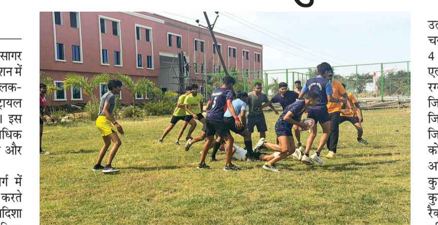
बालक वर्ग में भी गुलाबगंज ने अपना दबदबा जबाबि विदिशा को उपविजेता स्थान से बनाए रखते हुए विजेता का खिताब जीता, जबकि विदिशा को उपविजेता स्थान से संतोष करना पड़ा। चयन ट्रायल के दौरान

जिला रग्बी फुटबॉल एसोसिएशन द्वारा सागर रोड स्थित बेतवाचल ग्रुप ऑफ इंस्टीट्यूट्स में जिला स्तरीय जूनियर एवं सीनियर बालक-बालिका रग्बी फुटबॉल चयन ट्रायल प्रतियोगिता का आयोजन किया गया। इस ट्रायल में जिलेभर से 100 से अधिक खिलाड़ियों ने उत्साहपूर्वक भाग लिया और अपने खेल कौशल का प्रदर्शन किया।