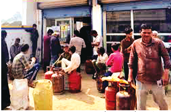
हरिभूमि न्यूज विदिशा

धरेलू गैस की किल्लत और समय पर होम डिलेवरी में देरी के कारण बाजार में इंडक्शन की डिमांड बढ़ गई है। प्रतिदिन करीब 70 से 80 इंडक्शन बिक रहे हैं। वहीं गैस एजेंसियों पर भी रोज सैकड़ों की संख्या में लोग गैस रिफिल कराने पहुंच रहे हैं। इधर पेट्रोल की किल्लत की अपवाहों भी शहर में चल रही हैं।